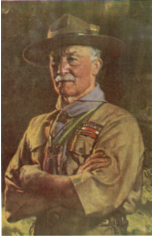
El Jefe Scout del Mundo del cuadro de David Jagger